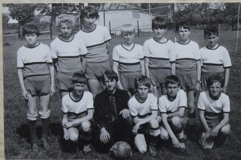
Zwycięska drużyna w piłce nożnej (Klasa VI)