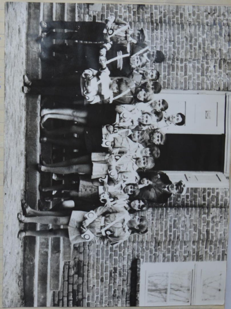
Drużyna M.S.R. przy uroczystości