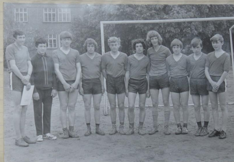
Zwycięska drużyna w piłce nożnej (Klasa VIIIc)