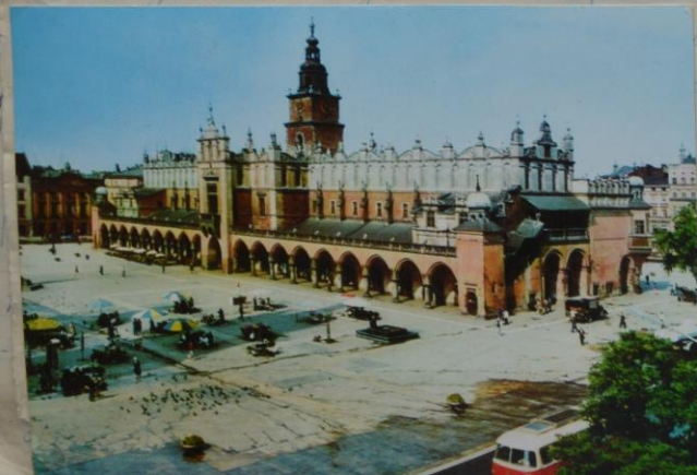
W akcji malarskiej

Przewodniczący Komitetu Rodzicielskiego zabrał głos i podziękował nauczycielom za wysiłek wykonany.