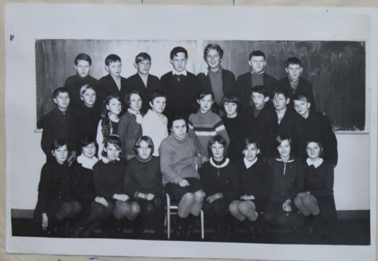
Klasa VI a z męskowodziasz, Anasickę heinarwem