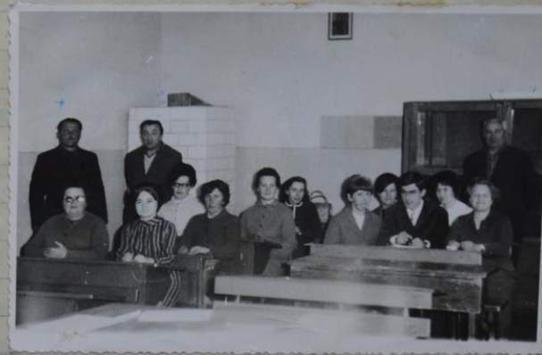
Grono nauczycielskie naszej szkoły